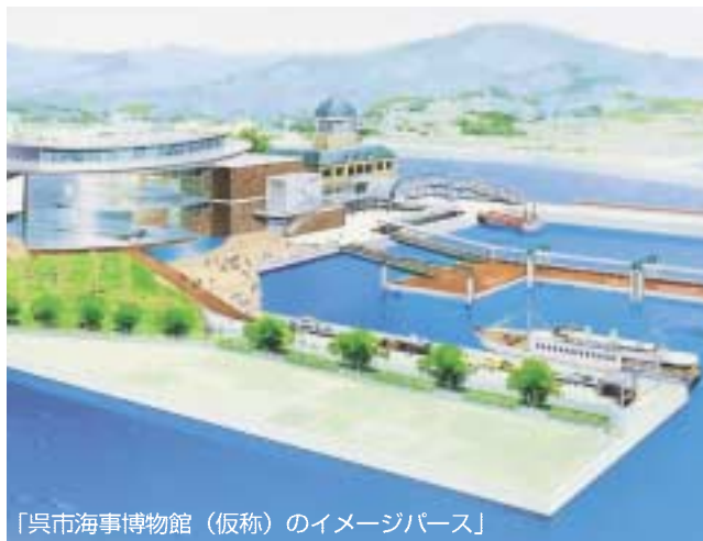
「呉市海事博物館（仮称）のイメージパース」

呉市は、広島湾の南東に位置し、気候穏和で自然環境に恵まれた、海と港を原点に発展してきたまちです。 もともと、天然の良港であった呉湾は、明治22年呉鎮守府の開庁に併い、「戦艦大和」を建造した東洋一の軍港、日本一の海軍工廠のまちとして栄え、戦後においては世界最大級のタンカーを生み出す