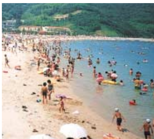
サザンセット・片添ヶ浜海浜公園

このコーナーでは、協議会に参画する各市・町のイベント、特産品、観光スポット、海との係わり等、様々な情報を毎月順次ご紹介して参ります。 第1回目は、海生都市圏構想の6つのゾーンの中で海洋拠点の中心に位置し、今年、市制百周年を迎える「呉市」をご紹介します。 身近な海への親しみ、広島湾域各地の現状とかくれた魅力を再発見していただければ幸いです。