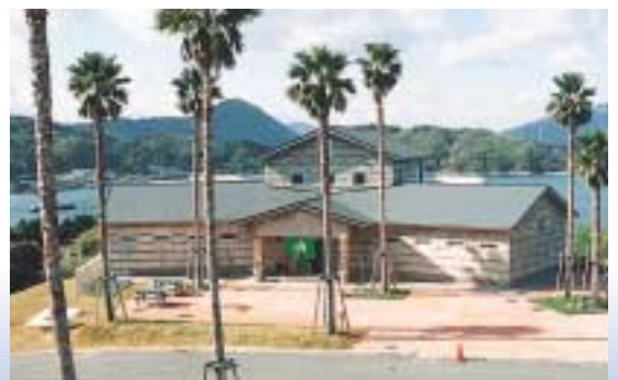
グリーンステイながうら・潮風呂保養館

(平成14年) 大島一周駅伝競走大会 ふるさと久賀夏まつり 12月15日(日) 8月15日(木) (問合せ先) 八幡生涯学習むらまつり 久賀町役場企画開発課 10月下旬 TEL (0820) 79-1008 みかん狩り 10月上旬～12月上旬 久賀町いきいきフェスティバル E-mail : kikakukaiha tu@town.kuka.yamaguchi.jp 11月3日(祝)