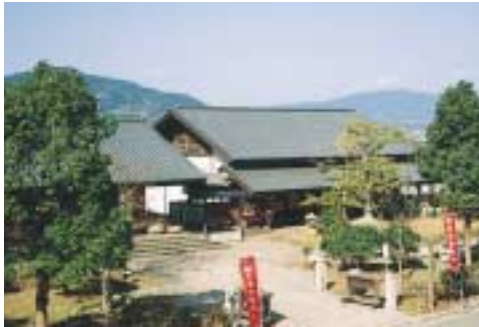
八幡生涯学習のむら

久賀町は、山口県東南端の瀬戸内海に浮かぶ周防大島の中央に位置し、海と山に囲まれた自然豊かな町です。標高600mを超す高山、嘉納山山頂からの360度に広がる展望や、まるで天女が舞い下りているかのように静かに流れ落ちる延命の滝など、多くの景勝地があります。また、八幡地区には、生涯学習の拠点施設、長浦地区には、スポーツ交流施設と保養施設を整備しています。本町では、みかん・いちご狩りや海水浴、釣りなどとあわせて一年を通して、たくさんのお客が訪れます。