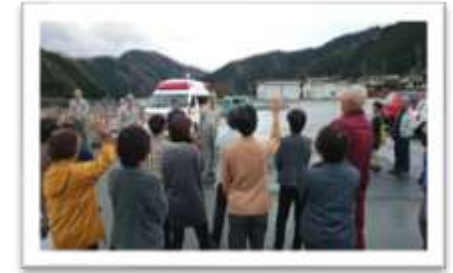
年に1度の危機管理研修