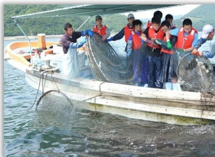
選択別体験プログラム 「定置網漁体験プログラム」