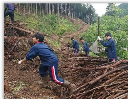
SDGs 取組みプログラム 「森林資源再生プログラム」