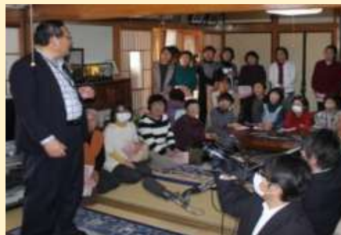
民泊受入実践研修