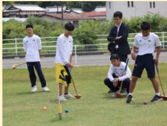
グランドゴルフ体験