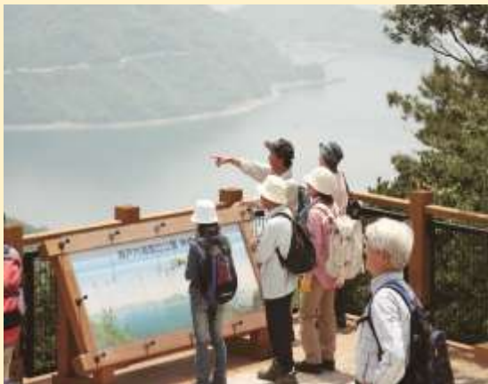
神峰山トレッキング体験